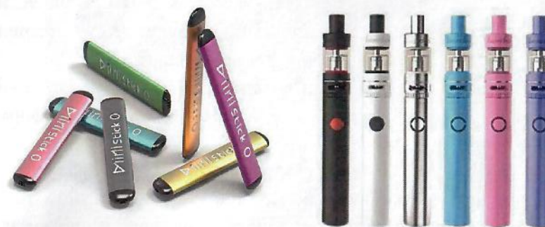
Рис. 5. Одноразовые (слева) и многоразовые (справа) электронные сигареты

Одноразовые ЭС рассчитаны на 200 - 500 затяжек пара. В многоразовых устройствах нет таких ограничений и они работают до тех пор, пока доливается жидкость в емкость.