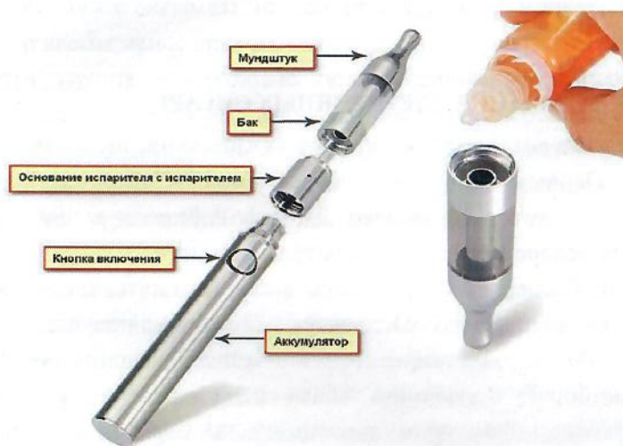
Рис. 3. Устройство электронной сигареты

Обычная электронная сигарета состоит из аккумулятора, электрического испарителя, емкости для жидкости, мундштука и дополнительных элементов для автоматического управления подачей ароматизированной жидкости (но последние имеются не во всех моделях), рис.3.