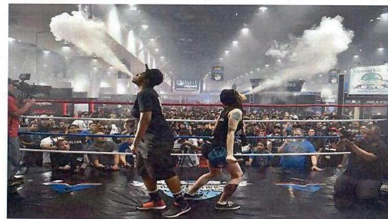
Рис. 2. Вейпинг соревнование

Быстрому распространению курения ЭС (вейпингу) способствуют компании-производители, которые превратили курение ЭС в целую субкультуру. В мире на регулярной основе проводятся субсидируемые компаниями-производителями выставки и соревнования среди курильщиков ЭС (рис.2). Это так называемые: «Cloudchasing» (мастерство выдувания облаков пара), «Tricks» (трюки с паром) и «Вейпинг-алхимия» (соревнования по составлению новых жидкостей для вейпа).