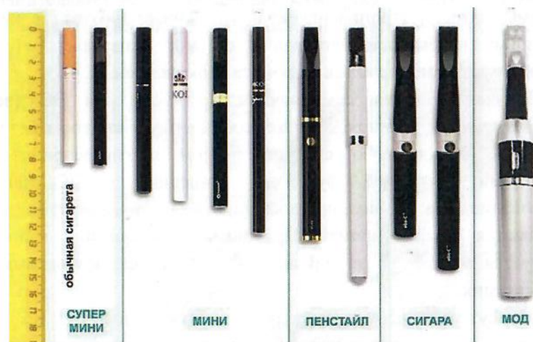
Рис.4. Типы и размеры электронных сигарет

Электронные сигареты (вейпы) классифицируются также по типу и размеру (рис.4) в соответствии с длиной (от 82 мм до 175 мм).